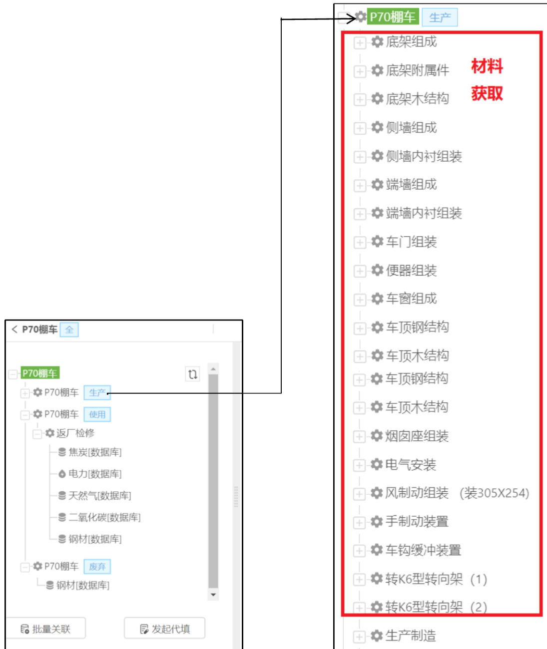
附图 1: eFootprint 上建立的棚车 LCA 模型截图